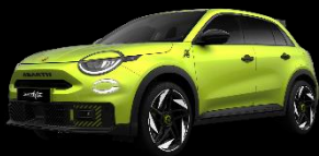
ACID GRÜN (Metallic)