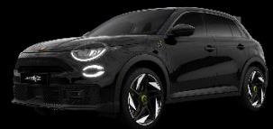
VENOM SCHWARZ (Solid)