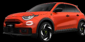
SHOCK ORANGE (Metallic)