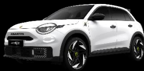
ANTIDOTE WEISS (Solid)