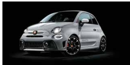
KIT ESTETICO WEISS Opt. 5HM