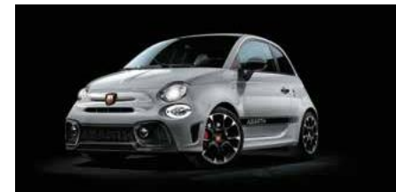
KIT ESTETICO SCHWARZ Opt. 5HN