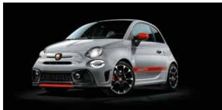
KIT ESTETICO Opt. 5HI