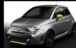
KIT ESTETICO PISTA GRÜN Opt. 2BK + 7PJ