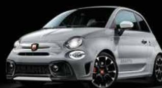
KIT ESTETICO WEISS Opt. 5HM