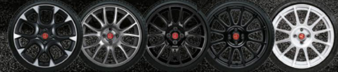
17" 17" 17" 17" 17" CORSA FORMULA FORMULA SUPERSPORT SUPERSPORT TITAN MATTSCHWARZ MATTSCHWARZ WEISS