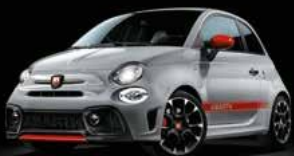
KIT ESTETICO Opt. 5HI