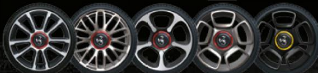
17" 17" 17" 17" 17" SPORT GRANTURISMO TOURING TROFEO SPORT SILBER MATTSCHWARZ