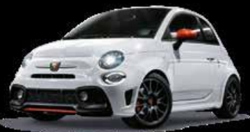
KIT ESTETICO PISTA ROT Serie