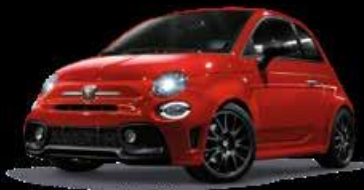
KIT ESTETICO PISTA SCHWARZ Opt. 5HQ + 7PJ