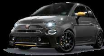
KIT ESTETICO PISTA GELB Opt. 5HR + 4TA