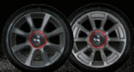
16" 8 SPEICHEN HERITAGE