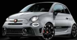
KIT ESTETICO SCHWARZ Opt. 5HN